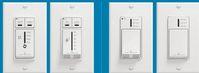
Commande automatique 41404